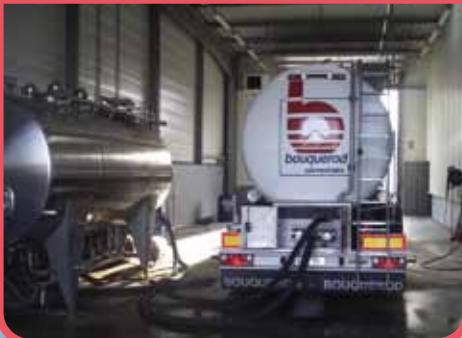
Station de lavage CIP