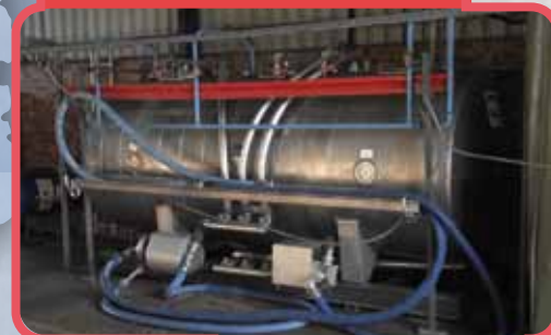
Station de lavage CIP